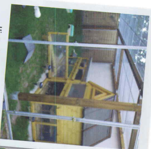
Hier sehen Sie ein Beispiel für gelungene Außenhaltung.

Im Krankheitsfall muss ein Meerschweinchen IMMER ins Haus!