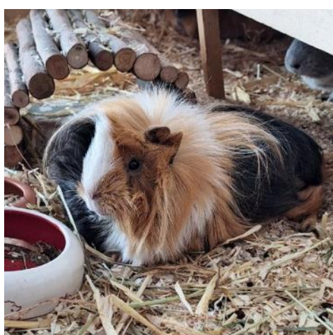
Egal ob kurzes oder langes Fell, beim Meeri-TÜV wird genau hingeschaut!

Das Fell von gesunden Meerschweinchen ist glänzend und ohne Verfilzungen und Verschmutzungen. Lediglich im Bereich des Kaudalorgans (ein Drüsenfeld am Hinterteil im Bereich des Kreuzbeins) kann das Fell durch das Talgdrüsensekret etwas fettig sein. Meerschweinchen putzen sich mehrfach am Tag selbst, sie benötigen niemals ein Bad (!) und brauchen bei der Fellpflege eigentlich keine Unterstützung (Ausnahme: Langhaarrassen).