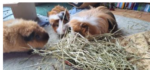
Hier riecht es doch nach Erbsenflocken?!

Wer gerade keinen Karton zur Hand hat, kann ein paar Leckerbissen auch einfach im frisch eingestreuten Gehege verstreuen statt sie in den Futternapf zu legen – auch so werden die Schweinchen animiert, ihre Nase zu nutzen und das Futter zu suchen. Das motiviert auch das ein oder andere eher gemütliche Schweinchen, eine Runde durchs Gehege zu drehen und sich damit etwas gesunde Bewegung zu verschaffen.